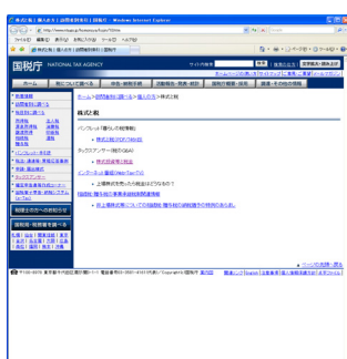
株式と税 | 国税庁 http://www.nta.go.jp/homonsya/kojin/10.htm