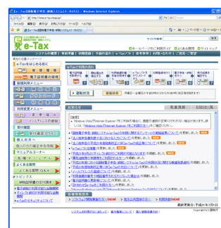
【e-Tax】国税電子申告・納税システム http://www.e-tax.nta.go.jp/