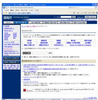
タックスアンサー | 税について調べる | 国税庁 http://www.nta.go.jp/taxanswer/index2.htm