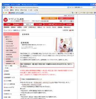
証券税制：カブドットコム証券 http://kabu.com/investment/syoukenzeisei/

税制は証券税制だけでもまだまだ沢山の制度や特例があります。ここではあくまで概略のご案内までですので、さらに詳しい内容をホームページ等を活用して確認しましょう。税金に関するご相談は税務署や税理士等の専門家にご相談ください。