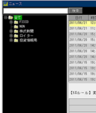
※画像は開発中のものです。

また、今回のニュース拡充に伴い、ニュースの配信元・種類ごとにフォルダが階層化され、必要な情報へアクセスしやすくなりました。